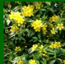
カロフイ・ジャズミン